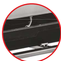
Wydajna pompa wodna