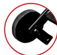
Kółka transportowe z możliwością blokady