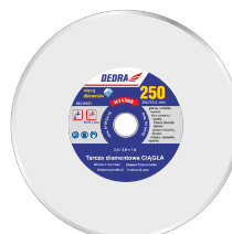
H1136E Tarcza zawarta w zestawie