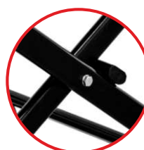
Solidna, stabilna podstawa