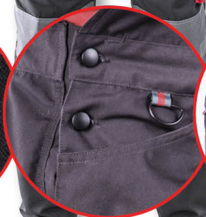
Regulacja w pasie