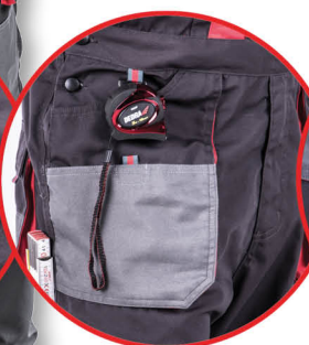
Kieszeń na smartphone'a