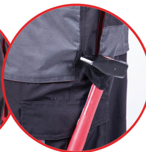
Szlufka na młotek

Spodnie ogrodniczki ochronne 65% poliester 35% bawełna, gramatura 265g/m 2 , potrójne szwy, wzmocnienie materiału na kolanach, regulacja w pasie gumką + guziki, 12 kieszeni (w tym 7 na rzep), kieszeń na smartfone'a, szlufka na młotek, oczko na klucze, szelki z regulacją długości, miejsce na nakolanniki, wszywka identyfikacyjna na „plecach” spodni.