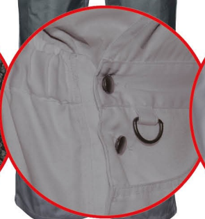
Regulacja w pasie