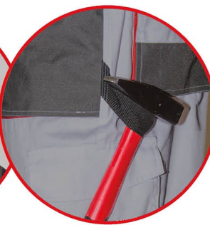
Szlufka na młotek

Spodnie ochronne ogrodniczki, kolor szary, 80% poliestru, 20% bawełny, 190g/m 2 , wzmocnienia na kolanach i kieszeniach, regulacja w pasie za pomocą gumki i guzików, potrójne szwy na nogawkach, 9 kieszeni (w tym 7 na rzep), szlufka na młotek, oczko na klucze