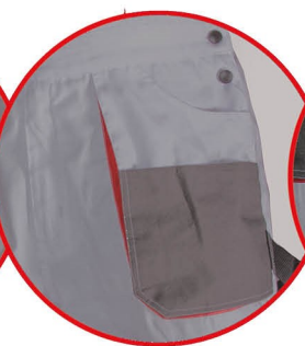
Kieszonka na smartfona