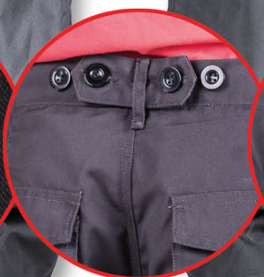
Regulacja w pasie