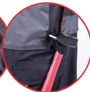
Szlufka na młotek

Spodnie ochronne 65% poliester 35% bawełna, gramatura 265g/m 2 , potrójne szwy, wzmocnienie materiału na kolanach, 9 kieszeni (w tym 6 zapinanych na rzep), kieszeń na smartfona, regulacja szerokości w pasie za pomocą guzików, szlufka na młotek, oczko na klucze, miejsce na nakolanniki