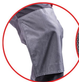
Wzmocnienie materiału na kolanach