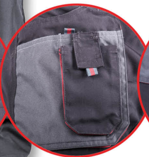
Kieszzeń na smartfona