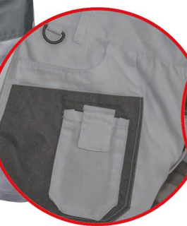
Kieszzeń na smartfona