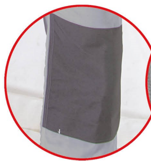
Wzmocnienie materiału na kolanach