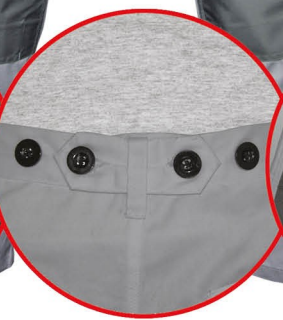
Regulacja w pasie