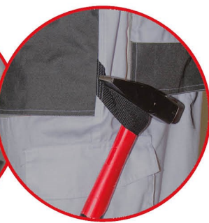
Szlufka na młotek

Spodnie ochronne kolor szary, 80% poliester, 20% bawełna, 190g/m 2 denim, wzmocnienia na kolanach i kieszeniach, regulacja w pasie za pomocą guzików, potrójne szwy na nogawkach, 9 kieszeni ( w tym 6 na rzep), szlufka na młotek, oczko na klucze