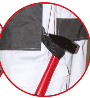
Szlufka na młotek

Spodnie ochronne biały kolor, 80% poliestru, 20% bawełny, 190g/m 2 denim, wzmocnienia na kolanach i kieszeniach, regulacja w pasie za pomocą guzików, potrójne szwy na nogawkach, 9 kieszeni (w tym 6 na rzep), szlufka na młotek, oczko na klucze