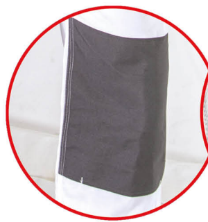
Wzmocnienie materiału na kolanach