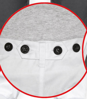
Regulacja w pasie