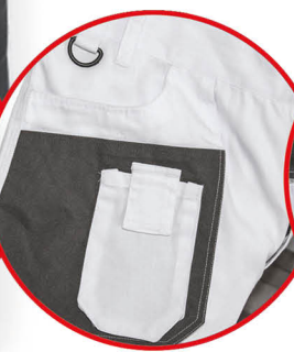
Kieszień na smartfona