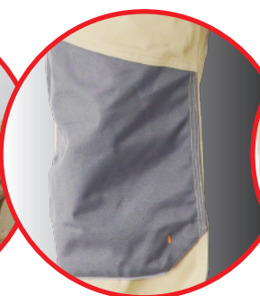
Wzmocnienia na kolanach i kieszeniach Strengthen material on knees and pockets area