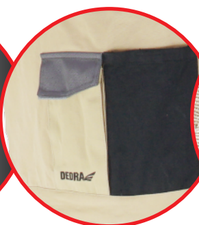
Kieszka na smartfona i wiele innych funkcjonalnych kieszeni/ Smartphone pocket and many other functional pockets