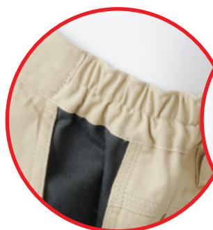
Regulacja w pasie Belt regulation