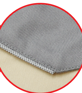
Elementy odblaskowe Reflective elements