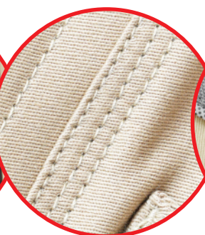
Potrójne szwy Triple stitches