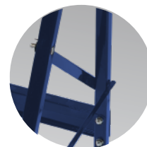
Profil stalowy 20 x 20 mm Steel profile 20 x 20 mm