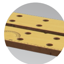
Płyta MDF 18mm MDF 18mm