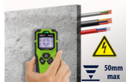
Przewody pod napięciem AC live cables