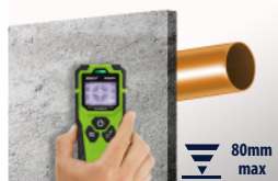
Metale nie-żelazne Non-ferrous metals