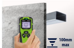
Metale ferromagnetyczne Ferromagnetic metals

PRODUKT POZWALA NA WYKRYWANIE W ŚCIANACH LUB SUCHEJ ZABUDOWIE / THE PRODUCT CAN DETECT IN WALLS OR DRYWALL: