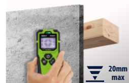
Profile drewniane (i więcej) Wooden profiles ( & more )